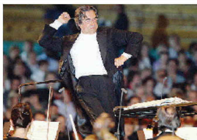
Riccardo Muti dirigerà il Concerto di Natale nell'Aula di Palazzo Madama

Ancora musica, ma di segno diverso dal Teatro Massimo Bellini di Catania per il concerto trasmesso il 24 dicembre.