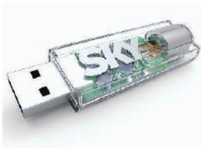
La Digital Key permette di vedere i programmi del digitale terrestre

Sorprese sotto l'albero di Natale per tutti gli abbonati Sky. A partire da 6 euro in più al mese con Sky si può avere un Tv full HD pagando 36 rate mensili (in abbinamento con la sottoscrizione di qualsiasi combinazione di pacchetti) e godere della grande offerta in Alta Definizione che, entro fine 2010, godrà di ben trenta canali. Grazie a questa offerta gli abbonati Sky potranno così assistere agli eventi sportivi preferiti con una qualità audio-video mai vista prima, anche in previsione delle prossime Olimpiadi e Paraolimpiadi invernali di